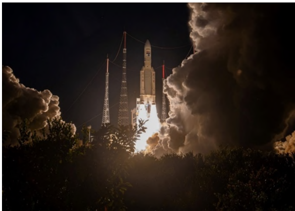
Abb. 1 Erfolgreicher Start einer Ariane 5 Trägerrakete.

Die Initiative der Partner im Projekt ENLIGHTEN beweist: Wenn Europa seine Kräfte bündelt, kann es auch weiterhin eine bedeutende Rolle in der globalen Raumfahrt spielen. Vom 22. bis 26. April 2024 präsentieren die Fraunhofer-ILT-Expertinnen und -Experten die aktuellen Ergebnisse aus dem laufenden Vorhaben für ein zuverlässiges und wettbewerbsfähiges europäisches Raumtransportsystem auf der Hannover Messe am Fraunhofer-Gemeinschaftsstand in Halle 2, Stand B24. Die Zukunft der europäischen Raumtransportsysteme sieht dank Vorhaben wie dem ihren vielversprechend aus.